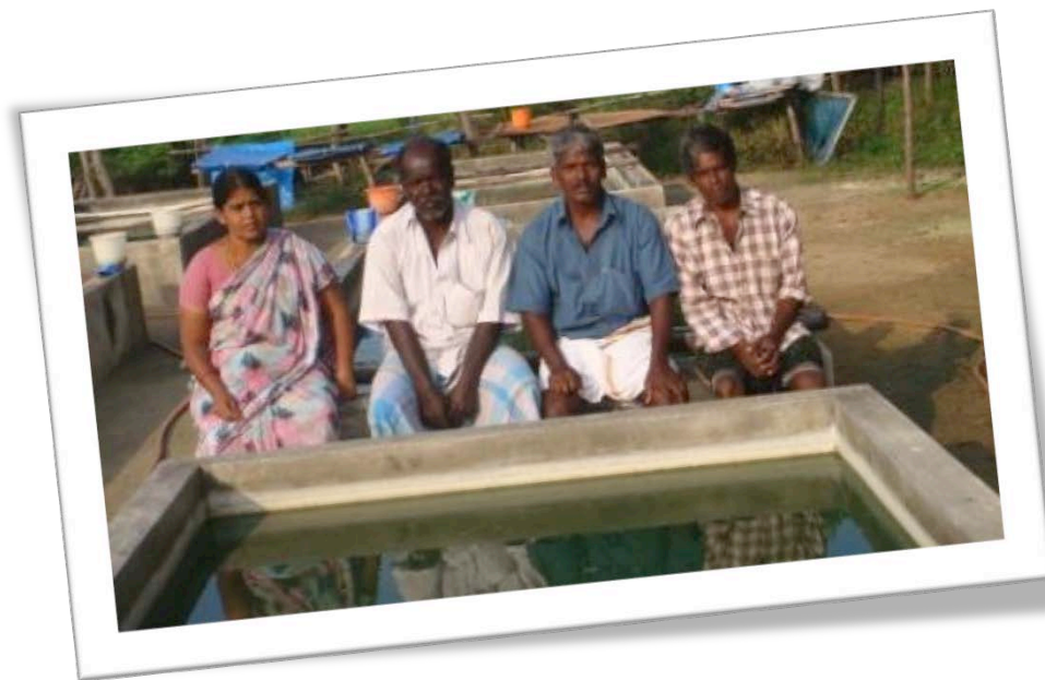
TOUTE L'EQUIPE DE PRODUCTION DE SPIRULINE